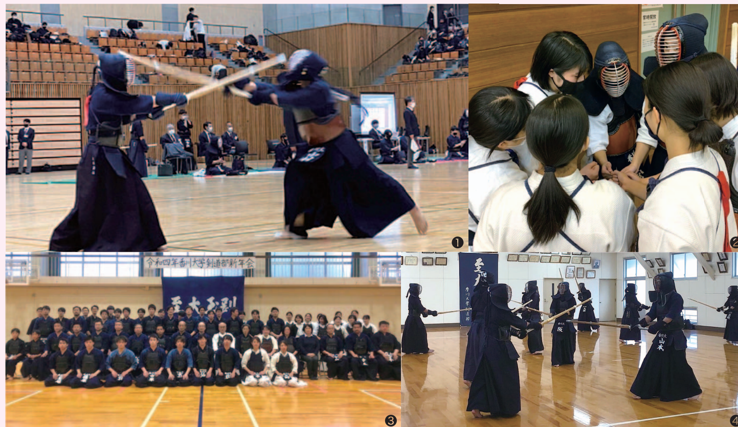
①面あり! ②試合直前、チームで士気を高める ③多くのOBの方々に来ていただき、とても盛り上がった新年会 ④稽古風景