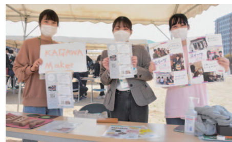
紹介ブース（学生プロジェクト「KAGAWA Maker」）