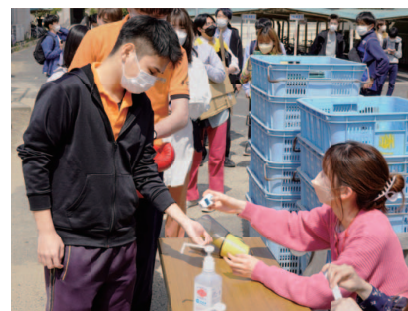
グラウンド入り口での検温の様子

昨年度に引き続き、感染対策として、入り口での検温・手指消毒の実施、ビラ配りや大声での勧誘を中止し、グラウンドでのサークル紹介と講堂での演奏等のパフォーマンスに限定して行われました。グラウンドでは100を超えるサークルやプロジェクト団体によるブースが並び、先輩学生が熱心に勧誘する姿が見られました。