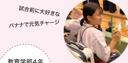
試合前に大好きなバナナで元気チャージ

活動場所・武道場 活動時間・月木 7:00 ~ 火金 18:30 ~ 土 10:00 ~ 部員数 ・29名 Instagram ・@kadai.kendo HP ・ https://www.5.hp-ez.com 連絡先 ・090-7987-6374