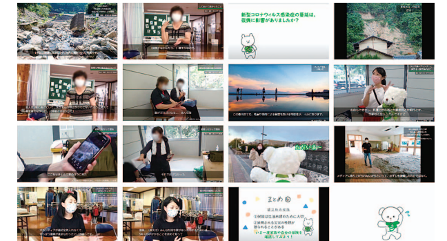
熊本大学公認ボランティアサークルの「熊助組」に撮影協力をいただき、熊本の被災を伝える映像を制作しました。被災された方からのお話は非常に貴重で、防災について考え、対策を「はじめる」きっかけになると考えます。