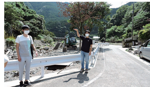
現地で取材・撮影を行っていただいた、熊本大学工学部公認ボランティアサークルの「熊助組」の方々。