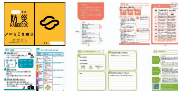
我が家の防災ハンドブック。自治体の既存のものなどを参考にしながら、子どもがいる香川県のご家庭にあったものを作成しました。災害時の避難計画を事前に立て、玄関においてもらえるように設計・デザインしました。