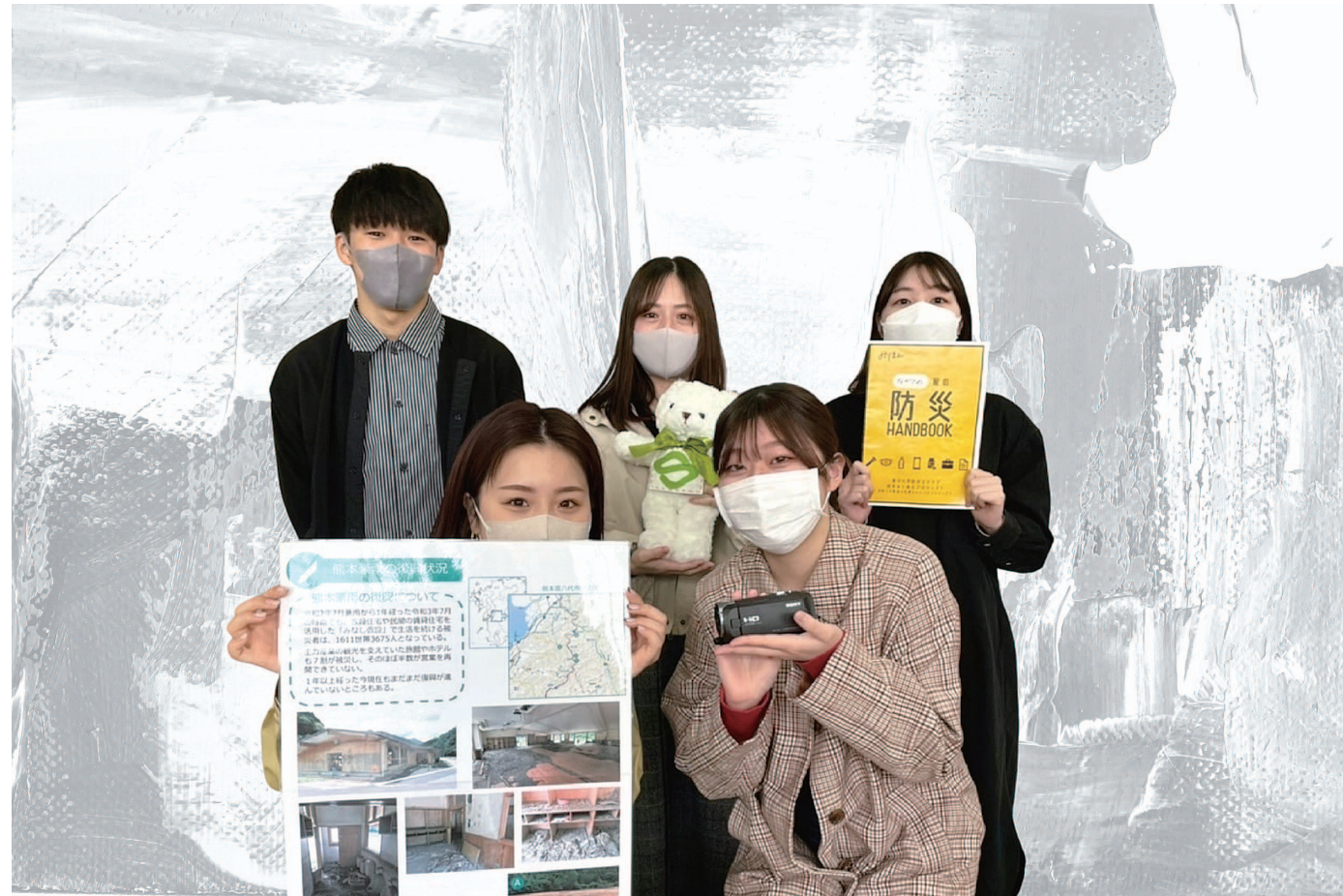
香川大学防災士クラブの同期とともに3人でプロジェクトを開始し、クラブで活動紹介をした際に、2人の後輩が興味を持ち参加してくれました。

コロナ禍でも、香川県の防災力向上や被災地の復興支援のためにできることがしたい。そんな想いでこのプロジェクトをはじめました。私たちが所属する香川大学防災士クラブは、被災地で復興支援ボランティア等を行っていました。感染症の影響で被災地での活動が減少したため、このような状況でもできる活動を企画し実行しました。代表的な活動を紹介します。