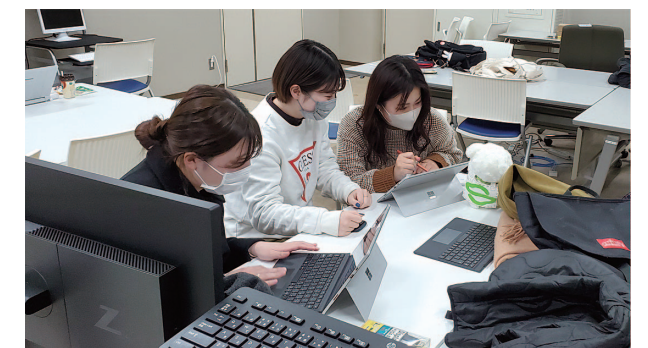
動画編集とアニメーション用イラスト作成の様子。全部員にとって初めての動画制作には、想像していなかった膨大な量の作業が待っていました。