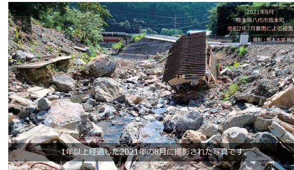
豪雨災害から1年以上経過した熊本県八代市坂本町の様子。家が流されており、災害の恐ろしさと、この地域の復興状況が読み取れます。これには坂本町の高齢化率の高さなどが背景にあります。