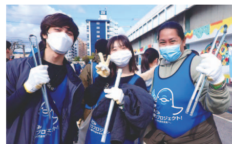
留学生・日本人学生の清掃活動中の様子

漁港周辺で調査を兼ねたごみ拾いを行いました。ペットボトル、タバコフィルター、食品の包装、食品容器、生活雑貨、ロープひもなどが多く見られ、ごみの回収量は152袋（30Lごみ袋）、245kgになりました。参加した学生からは「一人であまりできないが、皆さんと一緒にするとごみをたくさん拾えて、達成感があつた」などのコメントがありました。