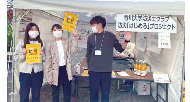
防災イベント開場を前に緊張を隠し切れない2年生（左）と久しぶりの地域の方との活動で心躍る3年生（中央）（当時）