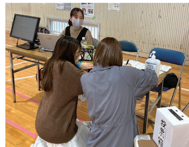
大学祭では標語コンテストを開催。標語作成のヒントとして熊本の災害についての展示パネルや、被災者の声を伝える映像を放映しました。